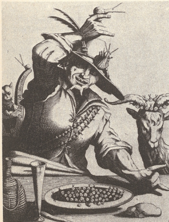
Jacques Callot : Les Cornes (Bibliothèque Nationale).