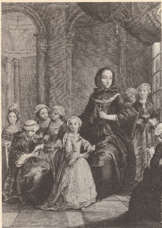
Je la fis élever selon ma politique (acte I, scène 1, v. 136). Tableau anonyme, Maison de Saint-Cyr (Musée Carnavalet).