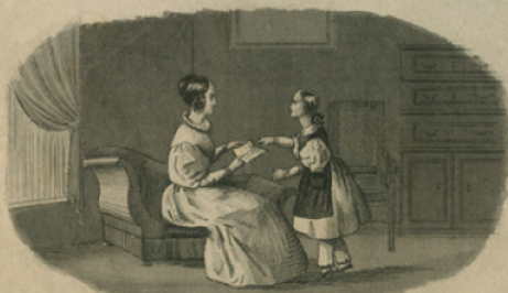
La petite fille qui sait tout.