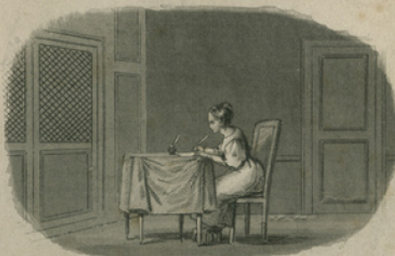
La bonne Fille.

Le modèle des petites filles. A PARIS. Chez Caillon, Libraire, rue St. André des Arts, N° 57.