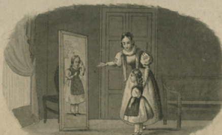
Les étrennes d'Antony.