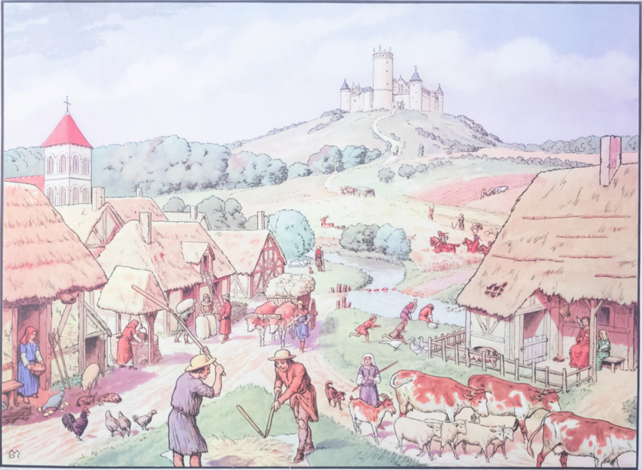
ILLUSTRATION N° 12 - LE GERMAIN EN LATE (B. & O.)

TABEAU N° 12 - LA VIE DES PAYSANS AU MOYEN AGE