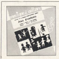
Jeux d'enfants (Bizet) ■ M C - 2503