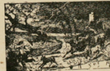
FIG. 181. — L'orage.

3. — Les éclairs et le tonnerre. — La pluie qui tombe en été est accompagnée d'autres phénomènes. Au moment des orages, le ciel est sillonné par des éclairs accompagnés de tonnerre.