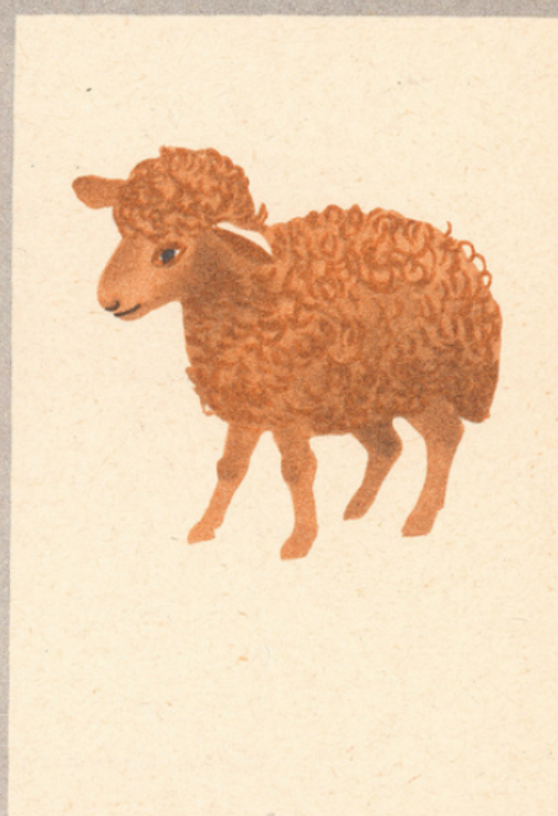
L'alène et ses amis