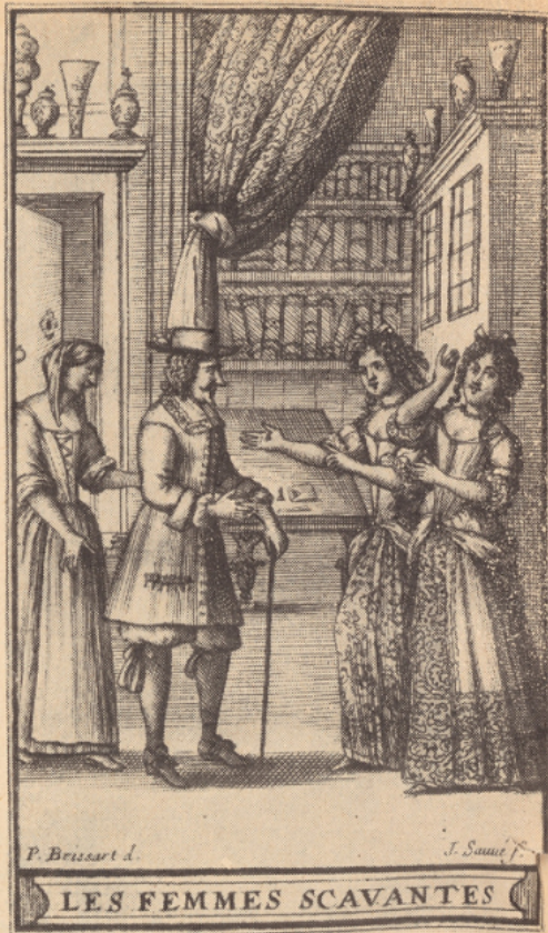
P. Brissart del. J. Saunier sc. LES FEMMES SCAVANTES