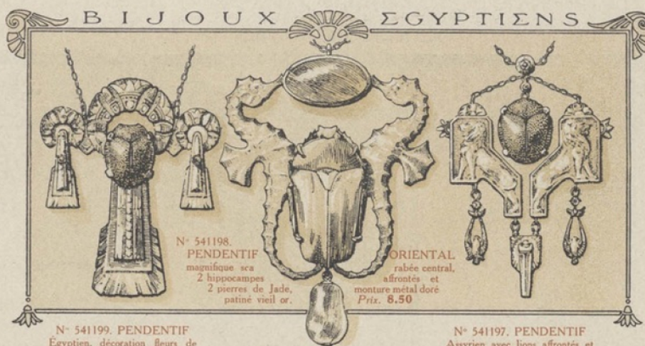
N° 541199. PENDENTIF Egyptien, décoration fleurs de lotus, centre scarabée, monture métal doré patiné vieil or. Prix. 6.90

Bague joaillerie forme marquise, centre perle fine véritable, monture platine et roses : créa-