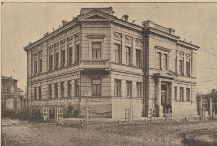
L'école du dimanche pour les femmes, à Kharkow.

Nous apprenons ainsi qu'en Russie, où les écoles primaires régulières manquent encore pour les filles dans la majeure partie des localités, les écoles du dimanche s'efforcent d'en tenir lieu. Créées dès 1861, à l'époque mémorable de l'affranchissement des serfs, elles n'eurent point tout d'abord de succès durable. La seule école de Kharkow parvint à se maintenir, grâce au dévouement infatigable, à la science pédagogique et aux gros sacrifices pécu-