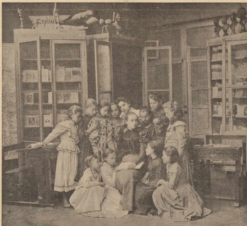
Un groupe à l'école de Kharkow, pendant le commentaire d'une lecture populaire.