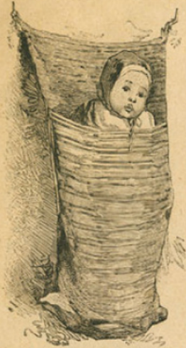
Nourrisson dans un sac, suspendu à un mur