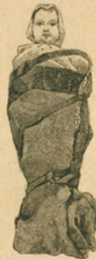
Maillot en usage dans les Basses-Pyrénées