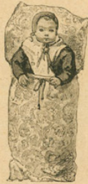
Nourrisson des provinces lorraines