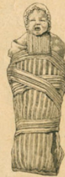
Maillot en usage en Bretagne