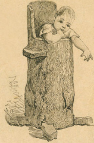
Tronc d'arbre évidé, en usage dans la Gironde pour l'éducation des nourrissons