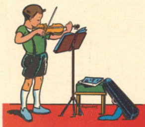
ré mi é tu die u ne mé lo die