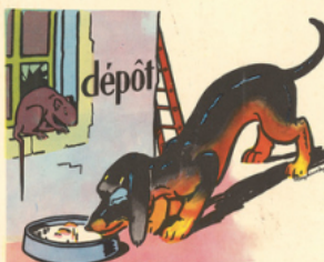
to bi di ne - un rat rô de