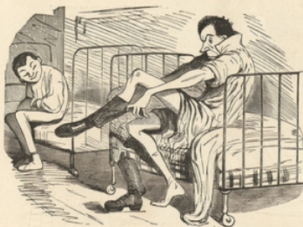
Le matin du grand jour.

Excorquato: Ayzas. Les Grecs aux belles bottes. (Housas.)