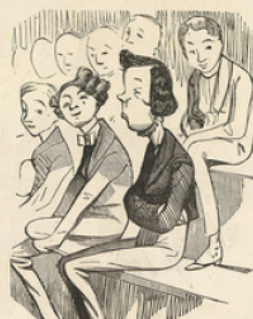
Messieurs les Extérieurs.

Eara avis in terris. Le phénix des hôtes de ces bois. (Jekissin). Thème latin. — Premier prix.