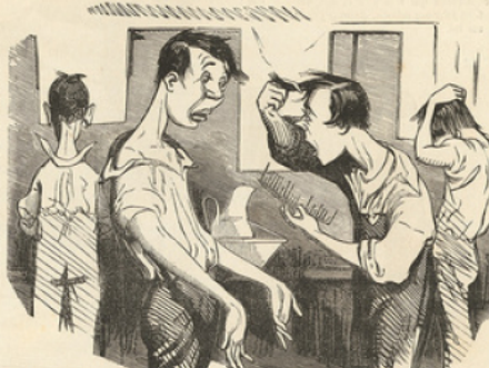
Le matin du grand jour.

A son fils, un père reconnaissant, pour son premier prix, sa première paire de bottes.