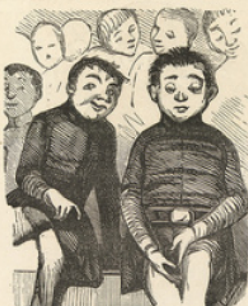
Messieurs les Internes.

— Passe-moi donc un peu de ta pommade pour que ça frise. — Mon cher, le pion me l'a filoutée.