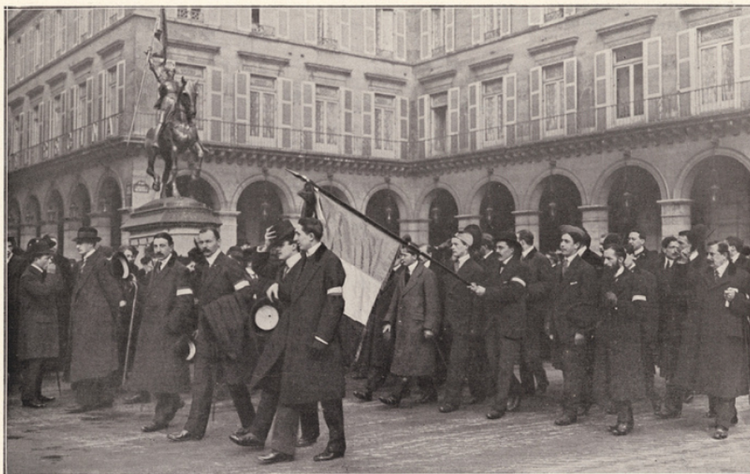
Le cortège des étudiants, se rendant place de la Concorde, passe rue de Rivoli devant la statue de Jeanne d'Arc.