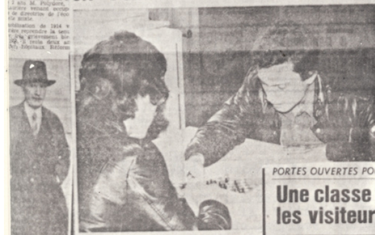
Notre photo représente un coin du Foyer de l'École normale tel qu'il était aux moments de détente.

Pour la première fois depuis cent ans, l'École Normale de Limoges ouvre ses portes au grand public et aux élèves de tous les degrés de l'enseignement du 2 e au 3 e degré de l'enseignement tous les après-midi de 14 h. à 18 h. Une occasion à ne pas manquer.