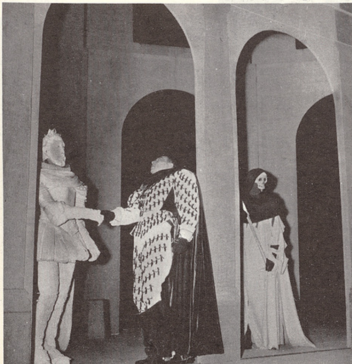
O ciel! que sens-je? un feu invisible me brûle... (Acte V, scène 6)