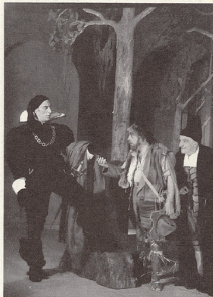
Prends, le voilà; prends, te dis-je, mais jure donc. (Acte III; scène 2)