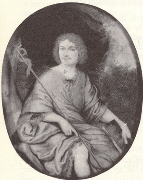
Un anonyme de XVII e (Musée de Pézenas) peint un Molière de pasto- rale tenant Dom Juan .

Pour la première édition de 1682 Brisard propose un Don Juan d'épo- que : pourpoint, rabat, chapeau à plumes. Bibl. de la Comédie Française.