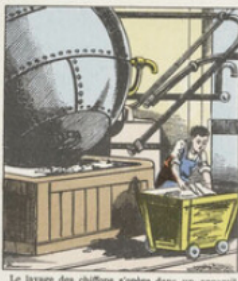
Le lavage des chiffons s'opère dans un appareil appelé pile lavante , constitué par une grosse sphère métallique mobile autour de deux tourillons creux par lesquels arrive de la vapeur qui barbotte dans l'eau où baignent les chiffons. On blanchit en même temps ceux-ci en ajoutant à l'eau de la soude ou de la chaux éteinte.