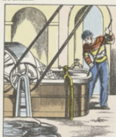
Une fois blanchis, les chiffons sont mis dans la pile défilante , qui les réduit en pâte ou pâte grossière. Cette pâte est alors conduite dans la pile raffineuse qui lui donne une homogénéité complète. C'est dans cette dernière pile que s'opère le plus souvent le collage et la coloration de la pâte.