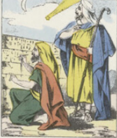
L'idée de fabriquer une matière propre à recevoir et à fixer l'écriture remonte à une haute antiquité. Les Chaldéens nous ont laissé les plus anciennes pierres gravées en caractères cunéiformes, et les hiéroglyphes égyptiens nous ont transmis les premiers modèles de lettres gravées sur des tablettes de pierre.

IMAGERIE D'ÉPINAL N° 3819 PELLERIN & Co, imp.-édit.