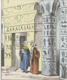
Tous les anciens palais de Babylone, de Perse et d'Égypte sont couverts de caractères hiéroglyphiques qui formaient l'écriture de l'époque et qui racontent la gloire des souverains qui les ont fait construire. Les peuples pouvaient ainsi lire leur propre histoire par leurs monuments.