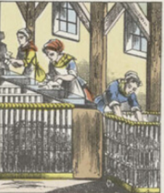
La fabrication mécanique du papier est, à peu près, la seule employée aujourd'hui. Les chiffons de tous genres qui constituent la matière première subissent d'abord deux opérations préliminaires qui se font à la main : le triage et le défilage.