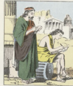
En outre de l'écriture à l'encre sur papyrus, les Grecs et les Romains employèrent, pour écrire, la gravure sur plaquettes de bois, les bandes de cuir ou les feuilles de parchemin. On recouvrait ces objets d'une mince couche de cire, et on y gravait en creux avec la pointe d'un stylet. Ainsi préparés, ces creux ou les appelait tabellæ .