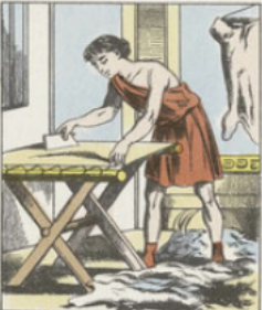
Le roi de Bérée, Attale II, inventa le parchemin, c'est-à-dire qu'il imagina d'employer, de préparer et de sécher des peaux de chèvre, de mouton et de jeunes veaux (c'est-à-dire de veaux de la dernière année), à l'effet de recevoir et conserver l'écriture. On écrivait sur ces peaux avec des encres de différentes couleurs.