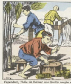
Cependant, l'idée de former une feuille souple et plate par le simple feutrage de fibres végétales appartient aux Chinois. En 105 avant J.-C. le ministre Tsai-Lou recommanda le papier et le bambou pour cette fabrication. Au X e siècle, les Arabes importèrent en Espagne la fabrication du papier de coton. C'est au XIV e siècle seulement que furent créées en France les premières papeteries de Troyes et d'Évrommes.