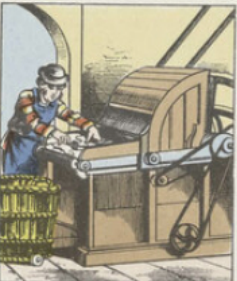
Afin de pouvoir travailler les chiffons, on les soumet à une COUPEUSE mécanique qui les débite en minces fragments. Cette machine peut ainsi couper chaque jour plusieurs milliers de kilogrammes de vieux chiffons.