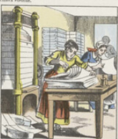
Le papier de qualité supérieure, destiné aux usages autres que les journaux, est coupé en feuilles suivant des formats usités, mis en presse, puis compté par paquets de 500 feuilles qui forment ce qu'on appelle une rame. La Rame se subdivise en 20 mains de 25 feuilles chacune.