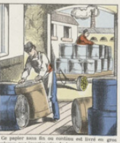
Ce papier sans fin est enroulé sur un grand rouleau aux imprimeries de journaux. Les presses à journaux sont alors réglées en ce qu'elles sont constituées au préalable par deux cylindres garnis des formes ou clichés entre lesquels le papier, passé enroulé, s'imprime à la fois recto et verso. À l'issue sont : une coupeuse qui coupe le journal aux dimensions voulues, et une plieuse qui le plie.