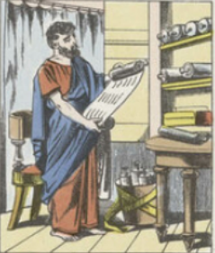
Les ouvrages écrits à l'encre sur papyrus étaient très nombreux dans l'antiquité, malgré leur haute valeur. Ces ouvrages formaient de longues bandes enroulées dans un étui sur lequel on écrivait le nom de l'ouvrage. C'est de ces rouleaux que vient même le mot VOLUME qui veut dire : enroulé.