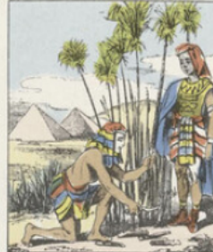
Les Égyptiens, 11 siècles avant J.-C., employaient l'écorce d'un rosier originaire d'Éthiopie, appelé Papyrus , d'où vient le nom de papier. Ils en formaient des rouleaux sur lesquels ils traçaient des caractères et des signes.