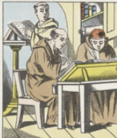
Le papier de papyrus d'Égypte fut employé jusqu'au VII e siècle de notre ère. À cette époque il fut généralement remplacé par le PARCHEMIN . Lorsqu'on voulait vulgariser un livre, on était obligé de le faire copier à la fois par plusieurs copistes sous la dictée d'un lecteur.