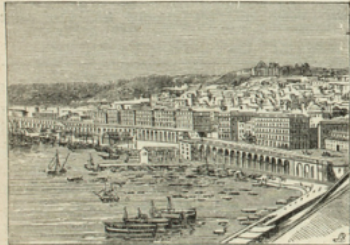
Port d'Alger. — Alger a été conquis en 1850. C'est le chef-lieu du département d'Alger, et la résidence du gouverneur général de l'Algérie.

cousin Vertamboz, il y avait beaucoup de cultivateurs français qui allaient s'établir en Algérie en qualité de colons. Au moment où ils débarquèrent sur les quais d'Alger (fig.), on leur donna avis que, le lendemain même, un explorateur célèbre, qui connaissait à fond l'Algérie, leur ferait une conférence pour les familiariser un peu avec leur nouveau pays. Presque tous se rendirent à cet appel, et, comme la conférence était publique, M. Vertamboz