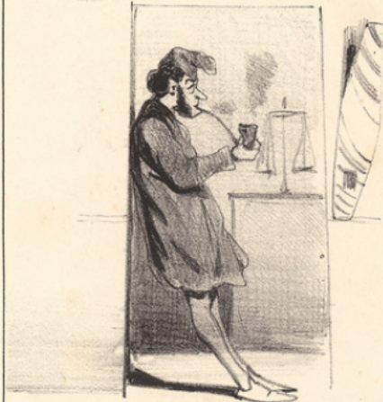
S'il a vaillamment résisté aux colles pendant deux ans, il sort dans les premiers et a droit d'être colloqué dans un bureau de tabac... C'est une position fort avantageuse, on ne risque pas de manger son fonds.