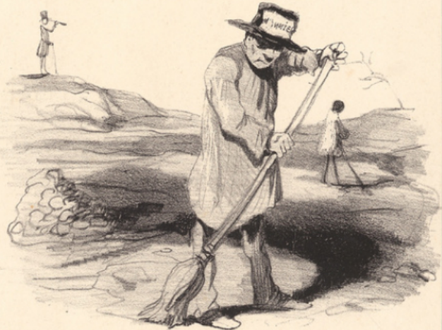
Mais il y a encore les ponts et chaussés... on peut être envoyé du côté de Castelnaudary ou de Brives-la-Gaillarde, surveiller le balayage des routes.