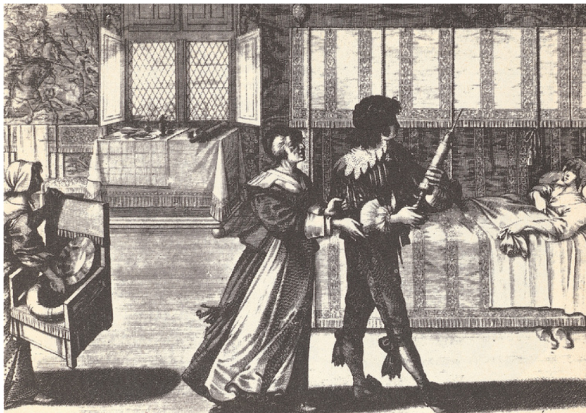
2 Le lavement, gravure d'Abraham Bosse.