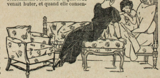
Elle saisit la main de la jeune femme.

Le silence de Mérouji était évidemment l'écueil sur lequel tout venait buter, et quand elle consen-