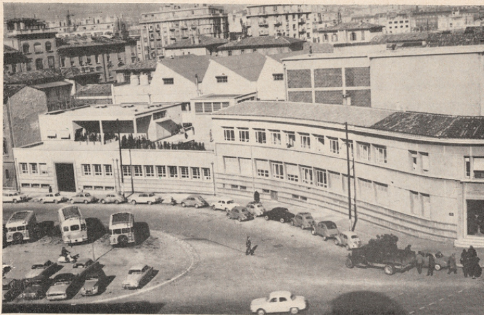
L'Institut de mécanique des fluides de Marseille.

La deuxième, ce sont les programmes scientifiques du baccalauréat.