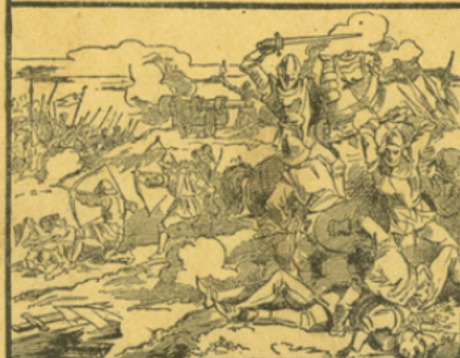
LA POUDRE A CANON