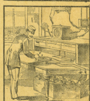
LE TÉLÉGRAPHE ÉLECTRIQUE