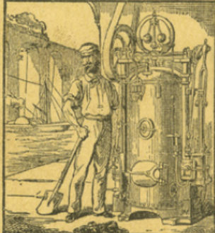
LES MACHINES A VAPEUR