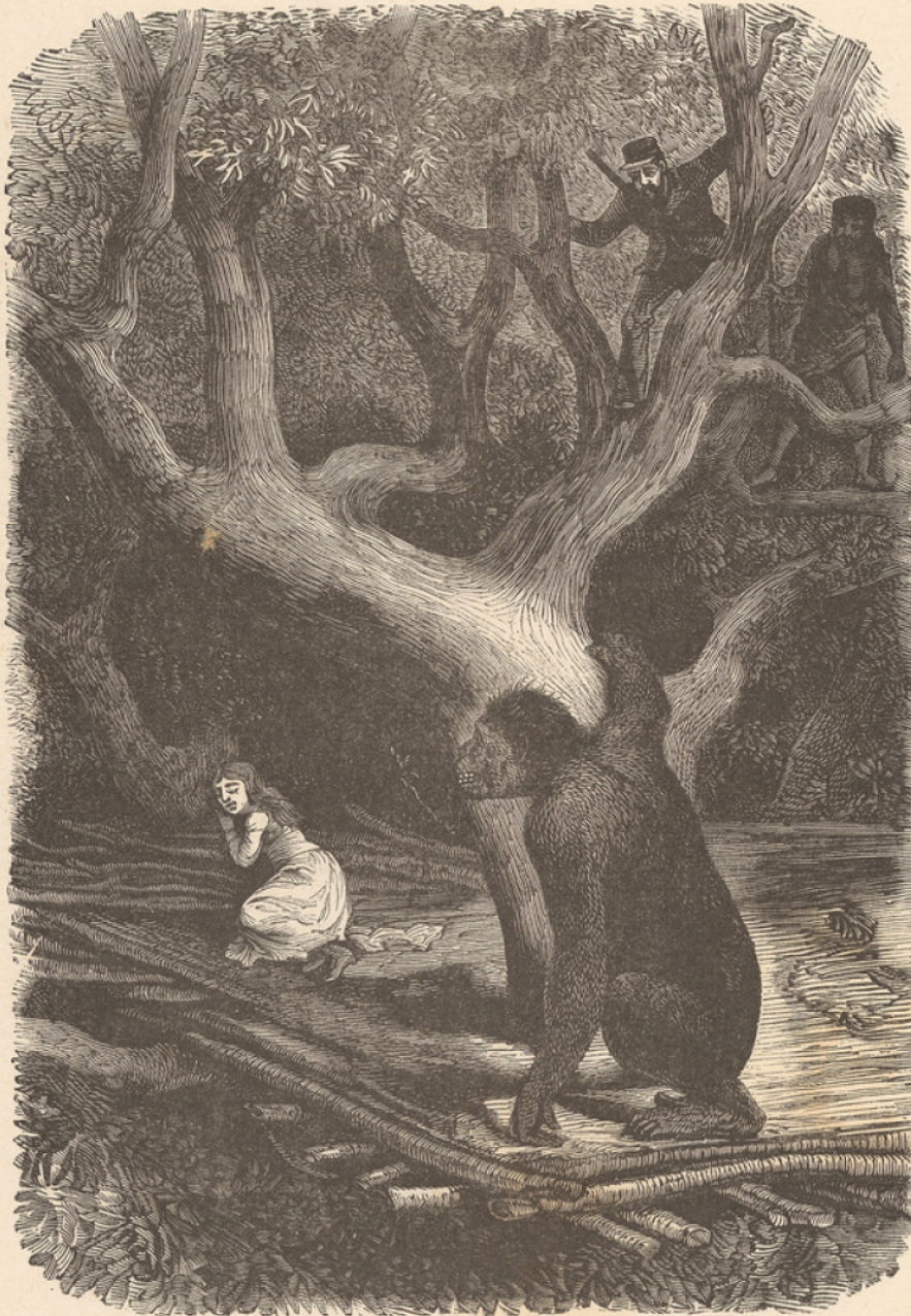
Il vit sa fille étendue sur la plate-forme.