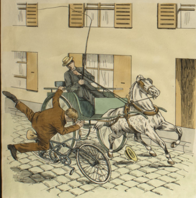
Etant à bicyclette ne pas se faire remorquer par un véhicule