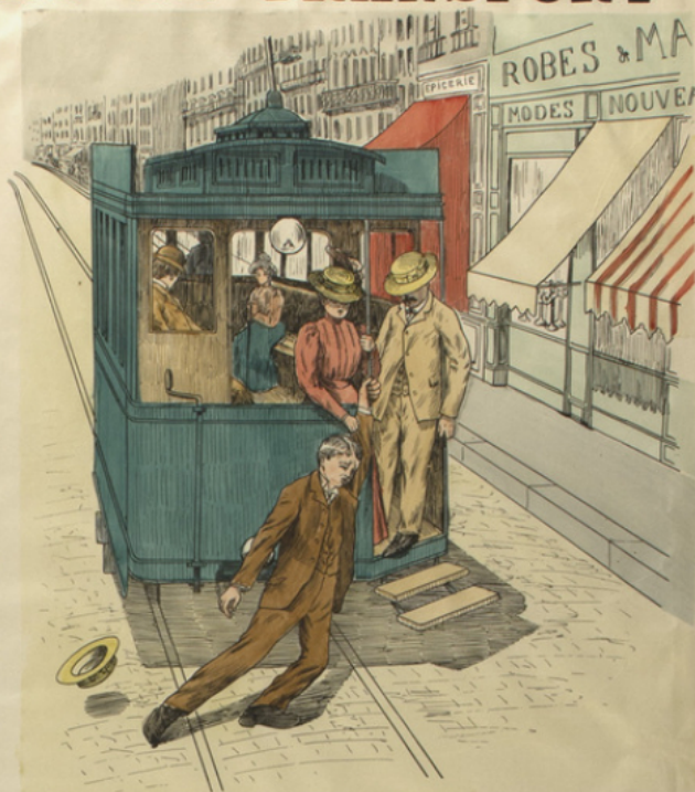
Ne pas descendre des voitures en marche