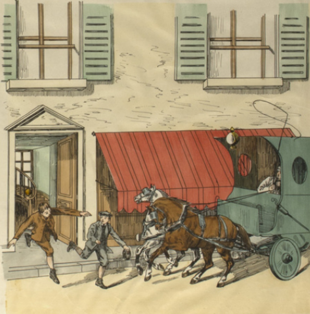
Ne pas sortir d'une porte dans la rue en courant