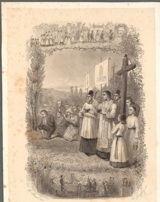
CÉNIE DU CHRISTIANISME

Les Hés chrétiens Fête Dieu, Belgique les Nos.