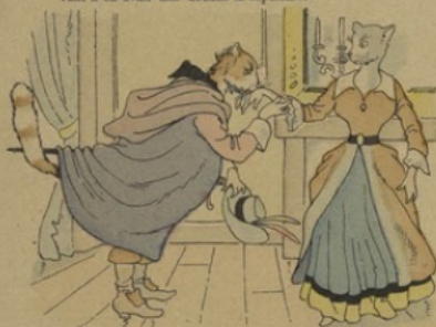
Or, un jour qu'au haut et au loin Le gaillard alla chercher femme,