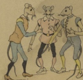
Le demeurant des Rats tint chapitre en un coin Sur la nécessité présente.