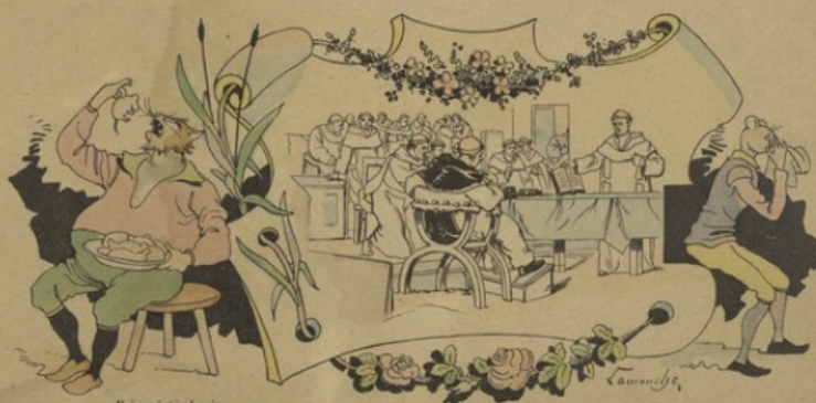
J'ai maints chapitres vus, Qui pour néants se sont ainsi tenus ; Chapitres non de Rats, mais chapitres de Moines, Voire chapitres de Chanoines.