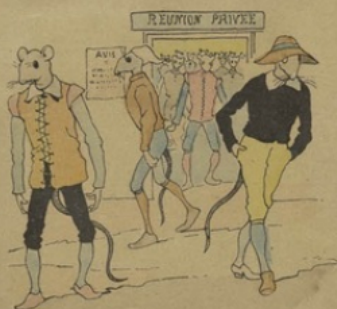
L'un dit : « Je n'y vais point, je ne suis pas si sot ». L'autre : « Je ne saurais », Si bien que sans rien faire On se quitta !...