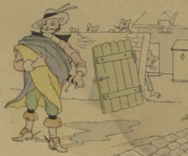
Et Rodilard passait, chez la gent misérable. Non pour un Chat, mais pour un Diable.