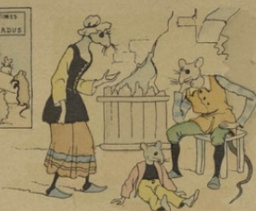
Le peu qu'il en restait n'osant quitter son trou, Ne trouvait à manger que le quart de son soûl;