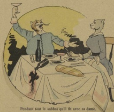
Pendant tout le sabbat qu'il fit avec sa dame,