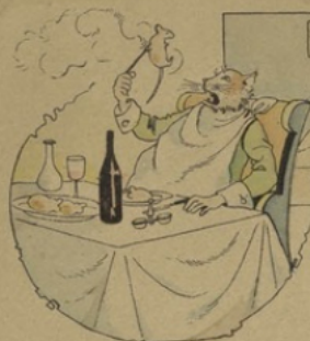
Un chat nommé Rodilardus. Faisait de rats telle déconiture Que l'on n'en voyait presque plus Tant il en avait mis dedans la sépulture.

Fables de LA FONTAINE, n° 23 (HORS GROUPES)