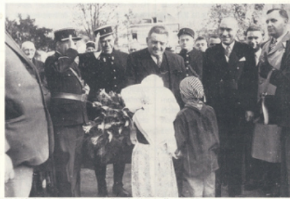
Pose de la première pierre de l'Ecole Maternelle « PAPE - CARPANTIER » par le Président Edouard HERRIOT (3 mai 1930).

tion à La Flèche, MOLIÈRE à Paris et RACINE, avec tous les autres maîtres, à Port-Royal-des-Champs. André MARIE fut leur héritier. Il aimait l'ordonnance architecturale classique, celle de son lycée, qui est aussi celle de l'Hôtel-de-Ville et de l'Hôtel-Dieu de Rouen.