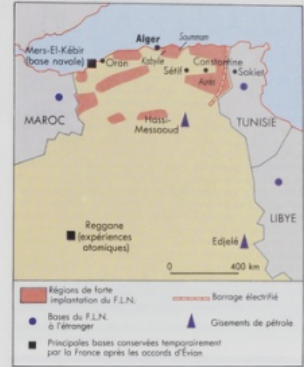
DOC. 20 L'Algérie (1954-1962).

■ Le gouvernement parvient très difficilement à imposer son autorité à l'armée, de plus en plus indépendante. La majorité de gauche qui soutenait Guy Mollet se désagrège : des ministres énoncent des critiques ; deux d'entre eux, Mendès France (hôte aux pouvoirs spéciaux) et Alain Savary, choqué par le détournement de l'avion de Ben