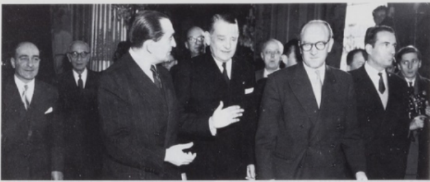
DOC. 16 Ministre Guy Mollet (1 er février 1956) : de gauche à droite, P. Mendès France, le président de la République René Coty, G. Mollet, F. Mitterrand.