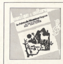
La Chèvre de M. Seguin (Baumgartner) ■ M C - 2505