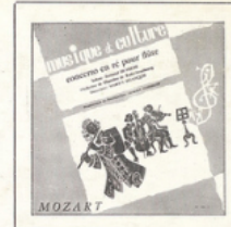
Concerto pour flûte (Mozart) MC - 3002