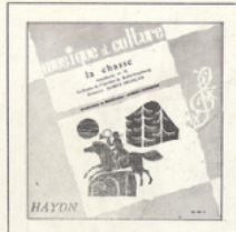
La Chasse (Haydn) M C - 3001

Production, réalisation, texte : Albert JUNGBLUT