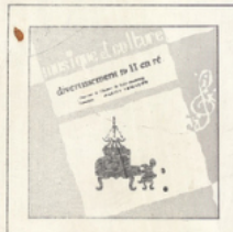
Divertissement en ré (Mozart) ■ M C - 2502 DIPLOME DU MEILLEUR DISQUE LOISIRS JEUNES