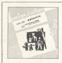
Casse-Noisette (Tchaikovsky) ■ M C - 2501