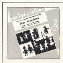
Jeux d'enfants (Bizet) ■ M C - 2503