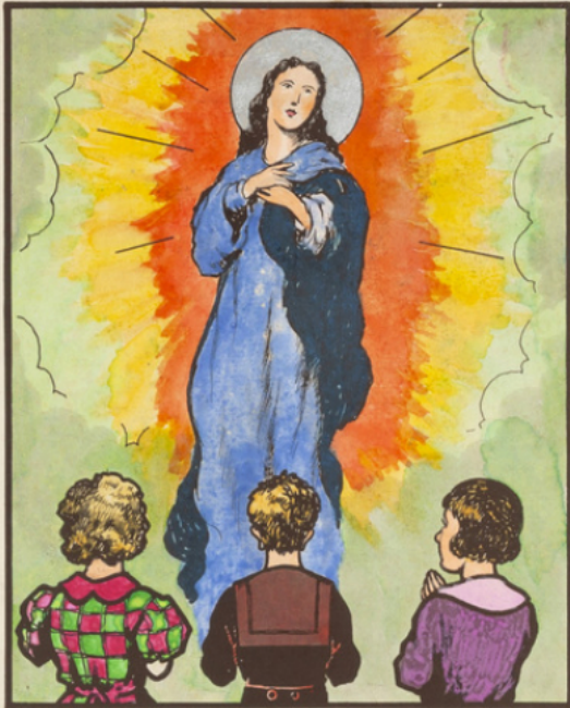
Pour rester purs priez la Très Sainte Vierge