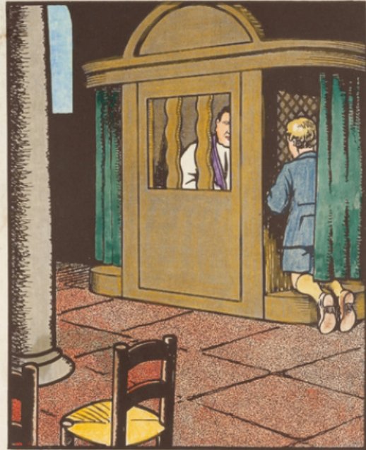
Usez de la confession et de la communion