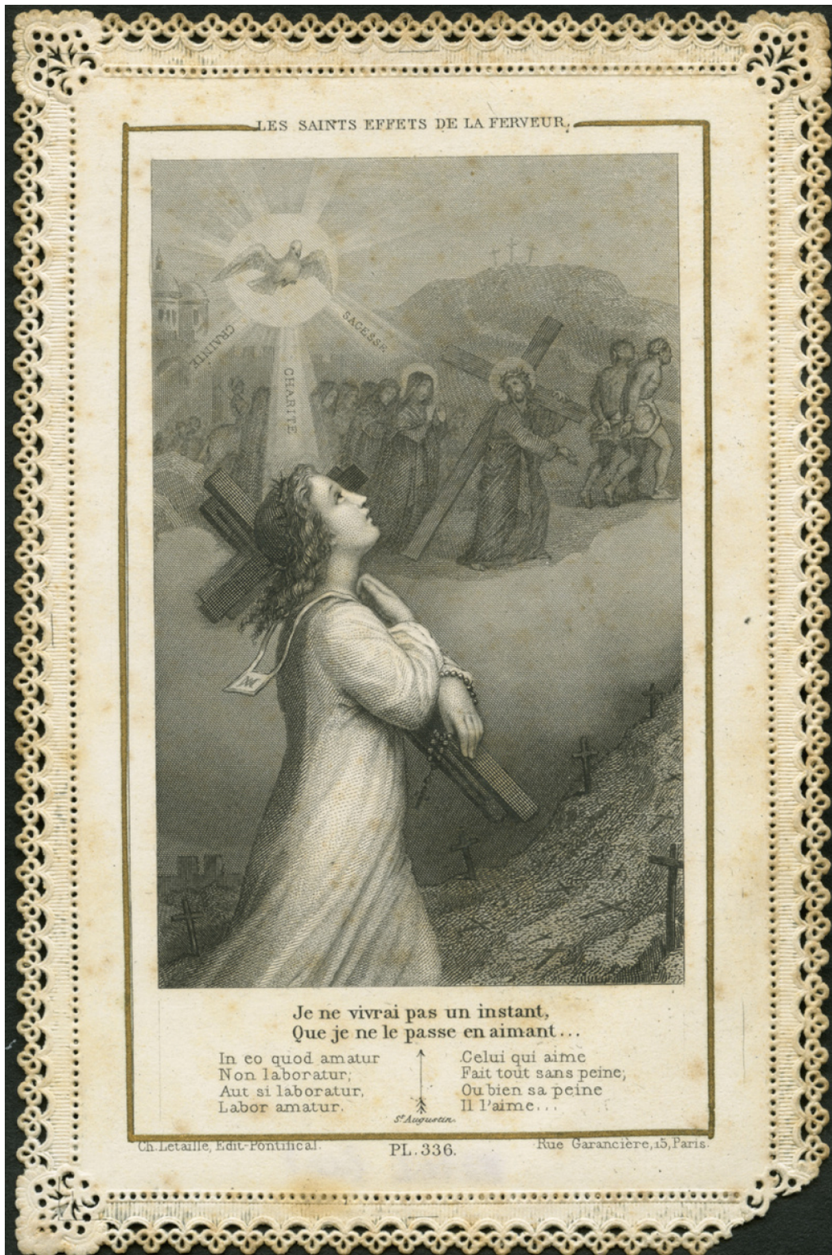
LES SAINTS EFFETS DE LA FERVEUR.