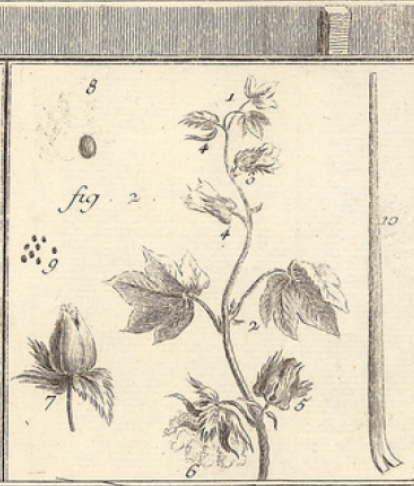
OEconomie Rustique, Culture et Arsonnage du Coton.