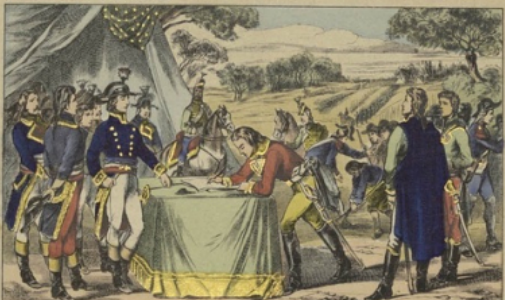
Le général Hoche pacifiant la Vendée.

Les Prussiens et les Autrichiens avaient envahi l'Alsace. Le général Hoche, envoyé par Carnot, tourne les Prussiens, descend à travers les glaciers et les neiges des Vosges, sur le flanc des Autrichiens. Le 22 décembre 1793, il emporte d'assaut les redoutes autrichiennes de Froeschwiler. Il bat de nouveau les Autrichiens à Worth, puis à Solsch. Les deux armées autrichiennes et prussiennes se réunissent. Hoche les attaque sur toute la ligne du Rhin aux Vosges. Le 20 décembre, il culbute les hostiles ennemis qui défendent la hauteur du Gelsberg, en avant de Wissembourg et rejette les Prussiens et les Autrichiens au-delà des lignes de Wissembourg et de Landau. Le territoire français est délivré par l'armée de la République, dans ces mêmes lieux où une autre armée française, aussi brava, mais moins heureuse, devait un jour succomber par la suite du second Empire.