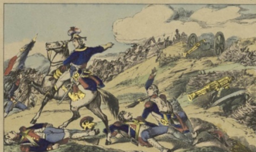
Hoche à Wissembourg repoussant l'invasion de l'Alsace.

Les Autrichiens et les Anglais avaient envahi le département du Nord. Carnot, après avoir organisé l'ensemble de la défense nationale, va prendre la direction de notre armée du Nord, que commandait Jourdan. Les 15 et 16 octobre 1793, Carnot et Jourdan attaquent l'ennemi établi dans la forte position de Wattignies. Repoussés une première fois, ils reviennent à la charge : une masse de cavalerie renverse notre avant-garde ; Carnot, descend de cheval, se met à la tête de notre infanterie, le fusil en main, et la ramène à l'ennemi. La cavalerie autrichienne est balayée, la position est emportée, et cette journée commence la série de nos victoires.