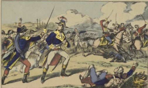
Carnot à Wattignies repoussant l'invasion de la Flandre.

Les Autrichiens et les Anglais avaient envahi le département du Nord. Carnot, après avoir organisé l'ensemble de la défense nationale, va prendre la direction de notre armée du Nord, que commandait Jourdan. Les 15 et 16 octobre 1793, Carnot et Jourdan attaquent l'ennemi établi dans la forte position de Wattignies. Repoussés une première fois, ils reviennent à la charge : une masse de cavalerie renverse notre avant-garde ; Carnot, descend de cheval, se met à la tête de notre infanterie, le fusil en main, et la ramène à l'ennemi. La cavalerie autrichienne est balayée, la position est emportée, et cette journée commence la série de nos victoires.