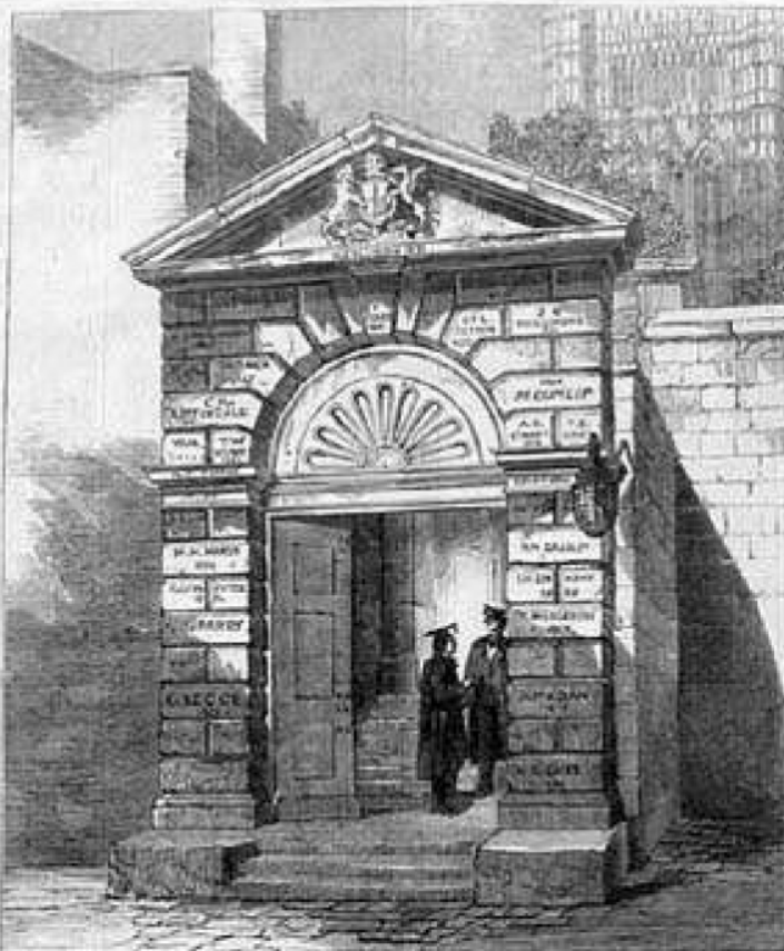
REPLACEMENT OF THE 1970S-1980S

Engl. "Wissenschaftliche"—a work which, published originally in 1877, has been revised through more than a hundred editions. It defined for decades the Professur of History which bore its name. Another of Wood's acts of fanaticism that he "was an exact Götter- und Menschenkunde, an exaktisches Wesen, Lektüre, und Schöpfung, und, above all, a political activity," as his students spoke of him.