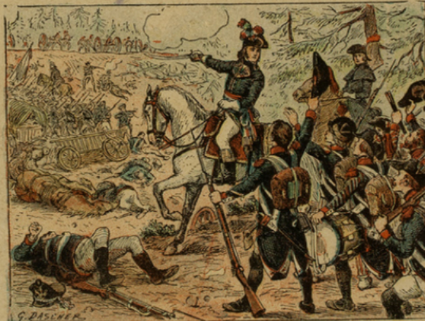
Hoche chasse les Prussiens d'Alsace