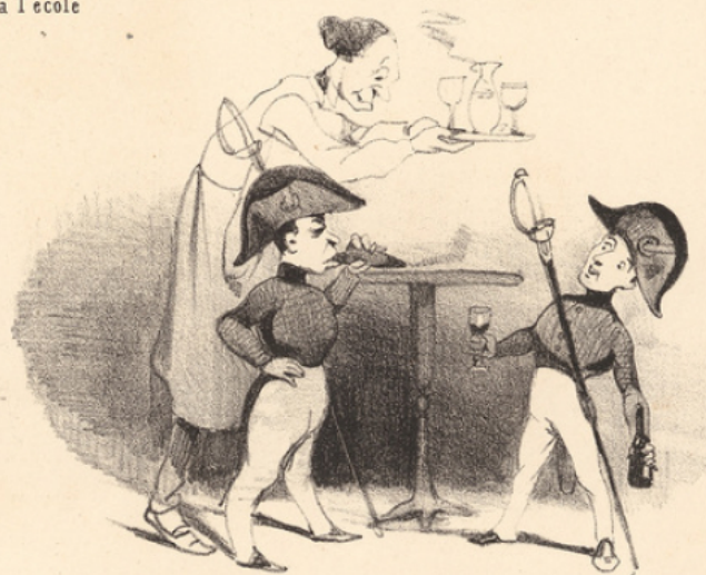
La taille de grenadier n'est pas de rigueur pour être reçu... voyez plutôt, le dimanche, au café des mille colonnes.