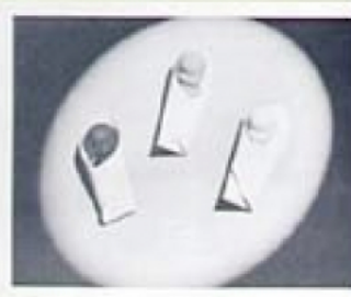
9 Pourquoi l'Homme souffre-t-il de tant de maux? Parce qu'il n'est pas libre. Il est asservi, opprimé, humilié, méprisé, déshonoré, humilié, méprisé, déshonoré.