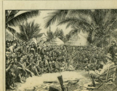
Fig. 6. — Le « palabre » de Brazza et du roi Makoko.