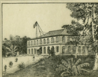
Fig. 5. — Le Palais du gouvernement à Brazzaville : le petit poste militaire est devenu une des villes les plus importantes de la colonie.