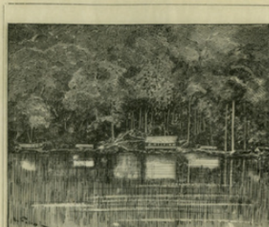
Fig. 8. — La forêt équatoriale sur les bords de l'Ogooué.