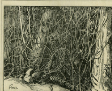
Fig. 11. — Quand le caoutchouc n'est pas cultivé dans des plantations, on l'extrait des lianes des forêts vierges.