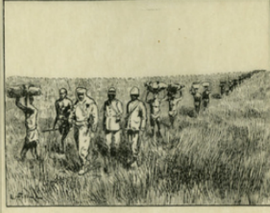
Fig. 2. — Brazza traversant la brousse africaine : tous les bagages doivent être portés à dos d'homme.