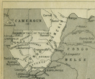
Fig. 7. — Carte du Congo français.