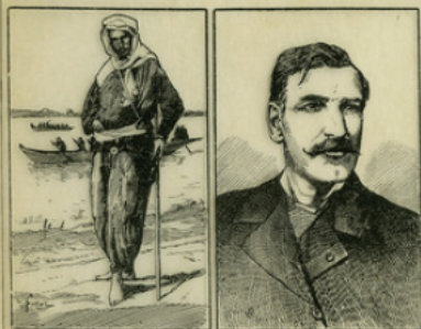
Fig. 1. — Brazza en explorateur (1880). Brazza en 1905.