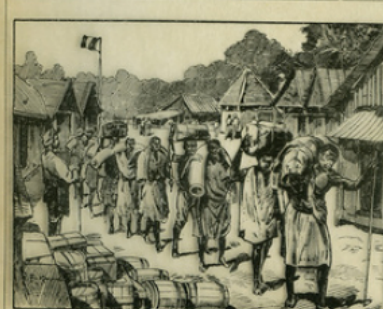
Fig. 10. — Caravane de porteurs arrivant dans une factorerie.