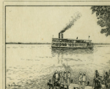
Fig. 12. — Le vapeur Dolisie, un des bateaux de la flottille fluviale du Congo.