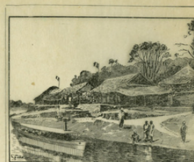
Fig. 9. — Poste militaire sur l'Ogooué.