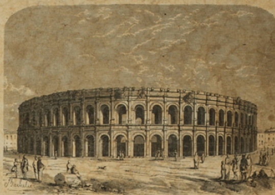
Les Arènes de Nîmes.

Nîmes est une des villes qui ont gardé le plus de vestiges de la période romaine; la Maison-Carrée est un temple qui remonte au temps d'Auguste; elle est en si bon état, qu'elle ne semble pas plus ancienne que les constructions modernes qui l'entourent; elle a servi de modèle à l'Église de la Madeleine de Paris.