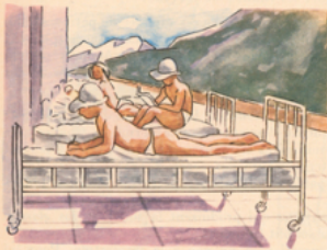
Traitement de la tuberculose des os, des articulations, des glandes, du péritoine, dans un sanatorium.