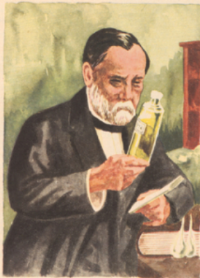
Pasteur dans son laboratoire. d'après Ebelfeld