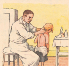
Vaccination contre la diphtérie.