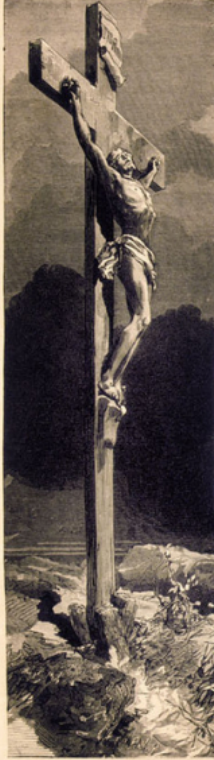
Reproduit de la Plume d'Alphonse

Vous le cherchez en vain sur la blanche muraille... Sans le Maître céleste il faut que l'on travaille. Celui qu'on invoquait, là, depuis si longtemps, Celui dont le nom seul inspirait la sagesse, Dont les bras étendus vous bénissaient sans cesse, On vous l'a pris, petits enfants !