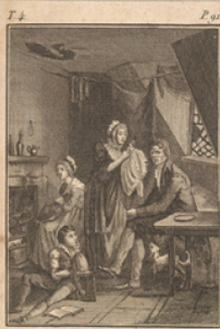
Suite de la description.

LES MATINÉES DE L'ENFANCE, OU HISTORIETTES AMUSANTES ET MORALES,