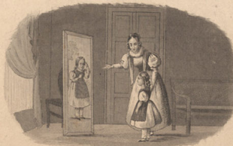
Les étrennes d'Anthony.