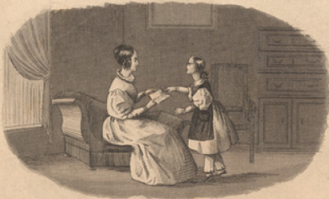
La petite fille qui sait tout.