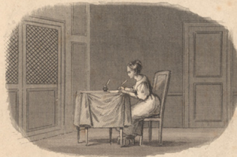
La bonne Fille.

Le modèle des petites Filles. A PARIS. Chez Caillot, Libraire, rue St. André des Arts, N. 57.