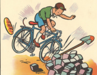
rémi n'a pas vu le tas de pavés