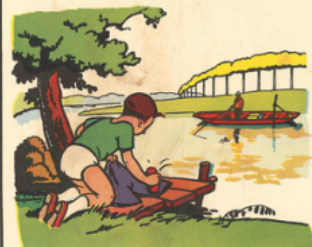
rémi à la rivière la véla culotte