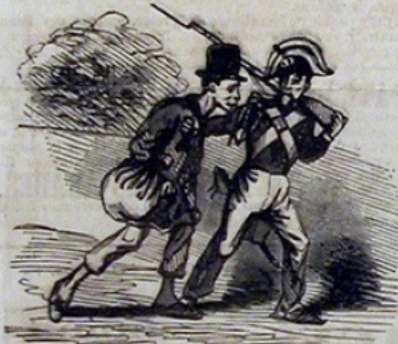
Suite d'une fausse interprétation du pronom possessif.