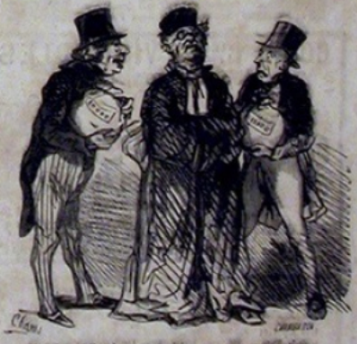
On relierà les deux propositions par une conjonction.