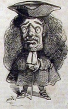
Accent circonflex sur un nez!