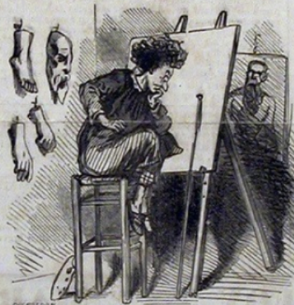
A la recherche du sujet.