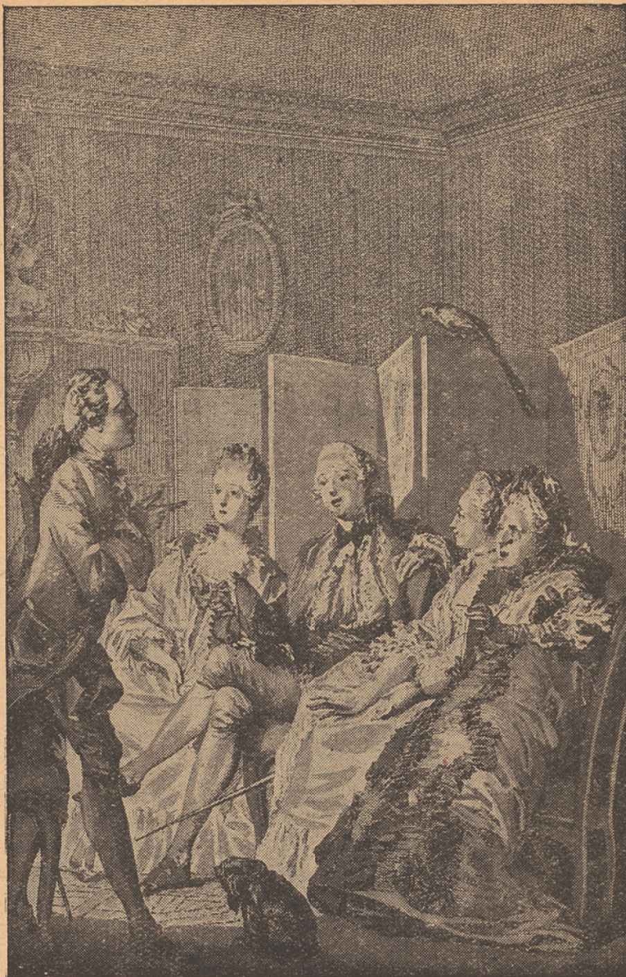
Dessin de J.-M. Moreau le Jeune pour l'édition du Théâtre de Molière ; Paris, 1773.

URANIE. — Vous êtes bien fou, chevalier.