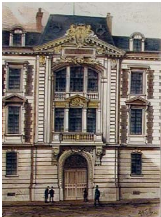
ENTRÉE DE L'ADMINISTRATION