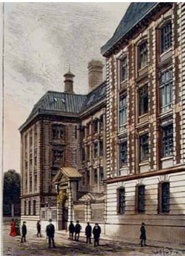
ENTRÉE DES ÉLÈVES