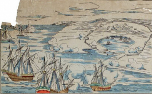
Siège de La Rochelle