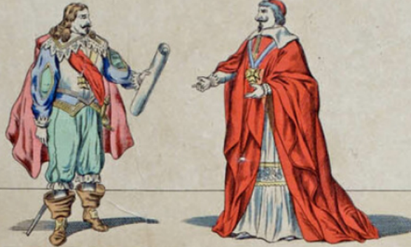
Louis XIII et le cardinal Richelieu