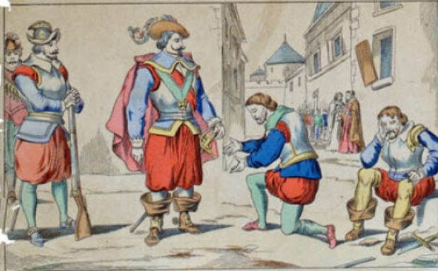
Capitulation de La Rochelle