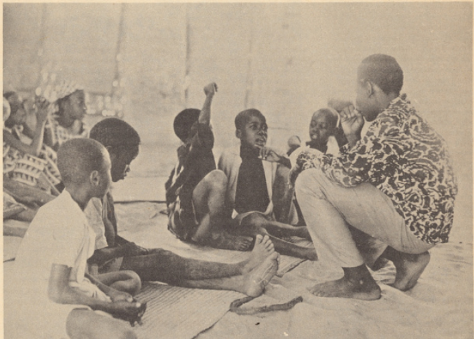
Après la réception collective de l'émission, le moniteur l'explique.

L'apprentissage de la langue française, conduit suivant une méthode semi-globale appuyée sur des centres d'intérêt, a accordé une priorité absolue au langage parlé. La lecture