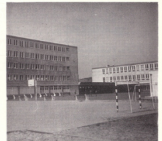
Vue de l'extérieur du C.E.T.