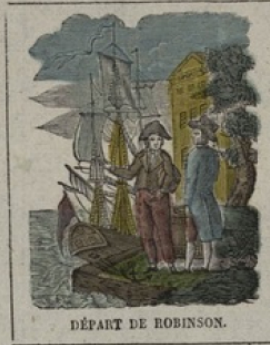
DÉPART DE ROBINSON.