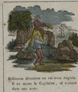
Robinson découvre un vaisseau Anglais. Il en salue le Capitaine, et revient dans son pays.