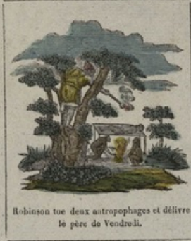
Robinson tue deux antropophages et délire le père de Vendredi.