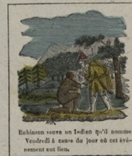
Robinson salue un Indien qu'il nomme Vendredi à cause du jour où cet événement eut lieu.