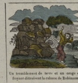
Un tremblement de terre et un orage effrayant détruit la cabane de Robinson.