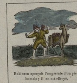
Robinson aperçoit l'empreinte d'un pied humain; il en est effrayé.