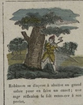
Robinson se dispose à abattre un grand arbre pour en faire un canot; une sage réflexion le fait renouer à son projet.